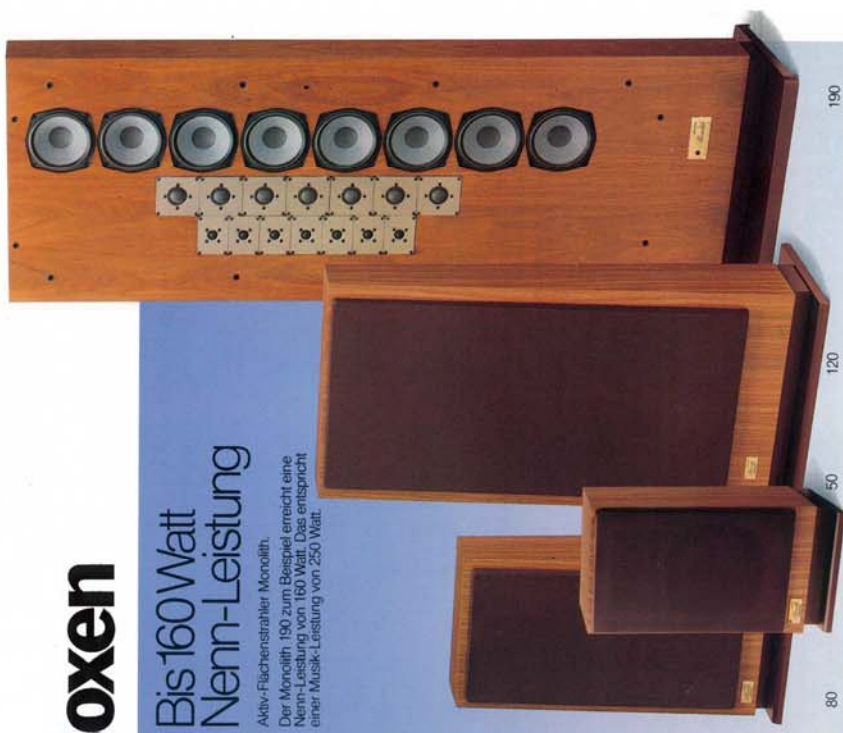
80 M 120 M 80 190

Aktiv-Flächenstrahler Monolith. Der Monolith 190 zum Beispiel erreicht eine Nennleistung von 160 Watt. Das entspricht einer Musik-Leistung von 250 Watt.