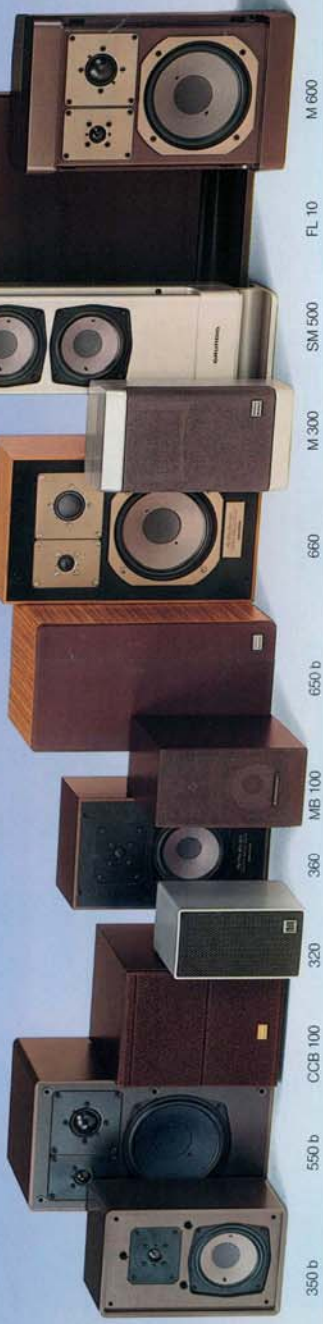
350 b 550 b CCB 100 320 MB 100 360 650 b 660 M 300 SM 500 FL 10 M 600

Am „muskaleschen Gleichgewicht“, der Ausgewogenheit des gesamten Übertragungsbereiches, erkennen Sie die hohe Klangqualität dieser vergleichsweise kleinen HiFi-Boxen. Ideale Maße – compact oder mini – ermöglichen überall problemlose Unterbringung. Wählen Sie zwischen Grundig HiFi-Boxen CCB 100, 320 und MB 100, die mit oder ohne Zierschallwand aufgestellt werden.