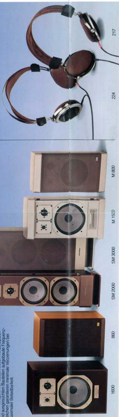
1600 880 SM 2000 SM 3000 M 1500 M 800 224 HiFi-Kopfhörer 217

Die Lautsprecher sind in modernster Schwingensulen-Technik ausgeführt. Ausschließlich mit Luftspulen und ausgesprochenen Bauteilen aufgebaute Frequenzweichen vermeiden jegliche Verzerrungen bei maximaler Belastbarkeit.