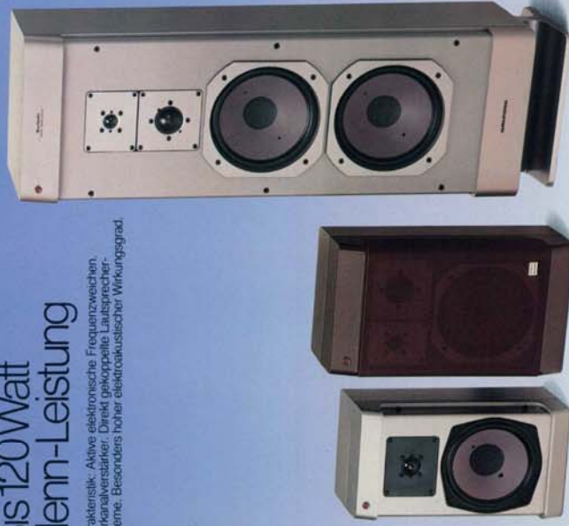
XM 400 XM 600 XSM 3000

Charakteristik: Aktive elektronische Frequenzweichen, Mehrkanalverstärker. Direkt gekoppelte Lautsprecher-Systeme. Besonders hoher elektroakustischer Wirkungsgrad.